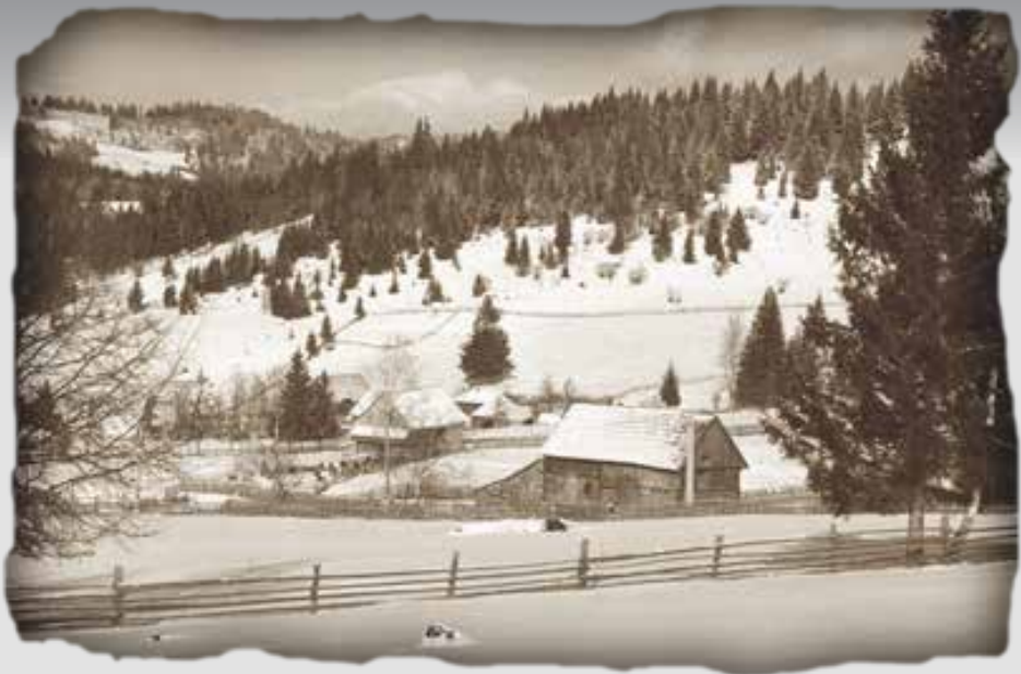
Az Úz völgye

A Vörös Hadsereg 1944. augusztus 26-án lépett Magyarország 1941-es területére az Úz völgyében. Ugyanezen hónap végén már megkezdődött az elhurcolás a Csíki-medencében. A Kárpátalját megszálló 4. Ukrán Front Katonai Tanácsának november 12-ei hírhedt, 0036. számú szigorúan titkos parancsa elrendelte a 18 és 50 év közötti német és magyar hadköteles személyek összeírását és hadifogolytáborba szállítását.