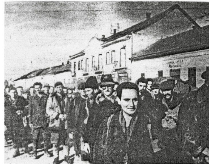
Útban a szolyvai láger felé

ták. Főris szülőfaluját 1944 októberében érték el az előrenyomuló szovjet csapatok. November 14-én kidobolták, hogy valamennyi, 18 és 50 év közötti jelentkezzen három napi munkára. Jelentkezett is becsületesen, többedmagával a faluból. A „szolyvai haláltáborba” vitték őket, mert az a hely mint mondja, másképpen nem nevezhető. Szolyva Munkáctól északkeletre fekszik, egyenesen a Vereckei-hágó irányában.