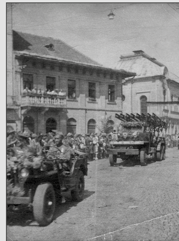
A Vörös Hadsereg bevonulása Munkácsra